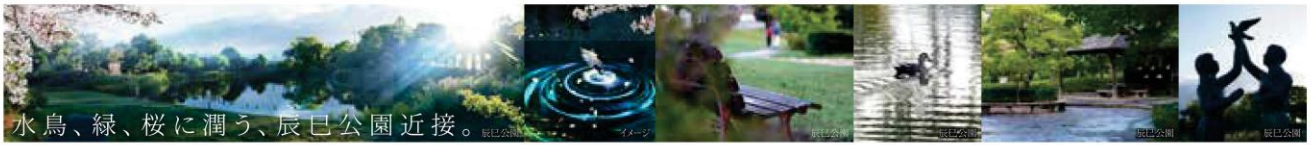
水鳥、緑、桜に潤う、辰巳公園近接。

※距離表示については現地からの直線距離を、徒歩分表示については180mを徒歩1分として算出(端数切り上げ)したものです。※掲載の写真は2023年10月に撮影し、CG加工を施したものです。