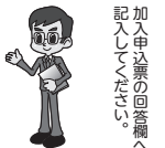
加入申込書の回答欄へ記入してください。

質問事項へのご回答は、保険会社の引受判断上、重要な事項のため、取扱代理店への口頭によるご回答ではなく、書面にてご回答くださいますようお願いいたします。 ※健康状態告知書質問事項回答欄は加入申込票兼被保険者明細書の一部となっています。取扱代理店は保険契約の告知受領権を有していますが、取扱代理店に口頭でご回答されても告知をしたことになりませんのでご注意ください。