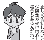
正しく告知しなかった保険金を受け取れない場合があります。

告知する事項は別紙「健康状態告知書質問事項」に記載しています。もし、故意または重大な過失によって、これらについて事実を告知しなかったり、事実と異なることを告知した場合、告知を受領した保険契約の保険期間の開始時(補償の開始時)※から1年以内であれば、引受保険会社は「告知義務違反」としてご契約を解除することがあります。 保険期間の開始時から1年を経過していても、告知のなかった事実、または告知の内容と異なる事実に基づく保険金支払事由が保険期間の開始時から1年以内に発生していた場合には、ご契約を解除することがあります。また、「告知義務違反」の内容が特に重大な場合、保険期間の開始時からの経過期間に関係なく保険契約を「詐欺による取消し」とすることがあります。 (注)継続契約の場合は、継続されてきた最初の保険期間の開始時となります。