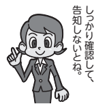
告知しなくても、ご自身で確認してください。

※「親介護一時金」「親介護休業補償」に新たに加入する方、継続して加入する際に、補償内容を拡大する契約条件の変更を行う方は、別途、親介護一時金・親介護休業補償の告知をいただく必要があります。 ※継続して加入する方で今回補償内容を拡大する契約条件の変更を行う場合は、補償内容拡大後の補償パターンに応じた告知が必要です。