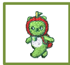
1: 胸・アルクマ刺繍