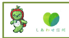
3: 胸・アルクマ刺繍 袖・しあわせ信州プリント