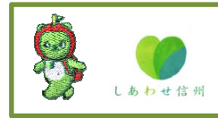
3: 胸・アルクマ刺繍 袖・しあわせ信州プリント