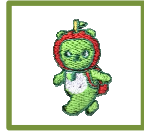
1: 胸・アルクマ刺繍